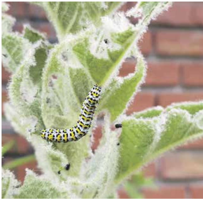
Raupe des Königskerzenmönchs auf einer Königskerze (Ulrike Wellige)

lieber zur Kornelkirsche greifen, die ebenso früh gelb blüht, aber füttert und Früchte trägt. Inzwischen bewohnen eher Prachtstauden und -gehölze aus fernen Ländern den Garten. Leider verdrängen sie heimische Pflanzen aus den Gärten und Köpfen. Und damit auch die Insektenarten, die sich im Laufe der Evolution an genau die angepasst haben. Auf manch