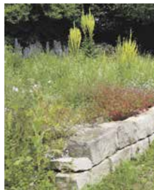
Beet mit heimischen Wildstauden (Tessa Beumer)

Nicht zu vergessen: Die immense Vielfalt an Larven von Blattkäfern und Zikaden. Sie nagen an ‚ihren‘ Futterpflanzen, rollen sich in Blätter ein, heften ihre Puppen oder