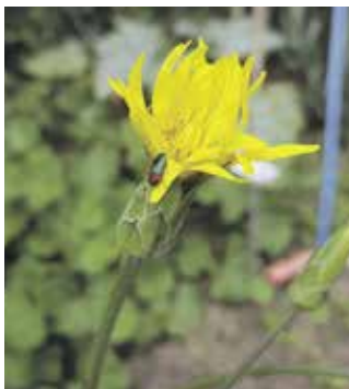
Anthaxia auf Schwarzwurzelblüte (Ulrike Wellige)

Die Blüten sollten ungefüllt sein. Sind bei Wildrosen die mit Pollen beladenen Staubbeutel offen zugänglich, so bleiben diese bei zahlreichen Zuchtrosen vor lauter Blütenblättern verschlossen. Eine andere ‚Betrügerin‘ ist die Zuchtform der Forsythie.